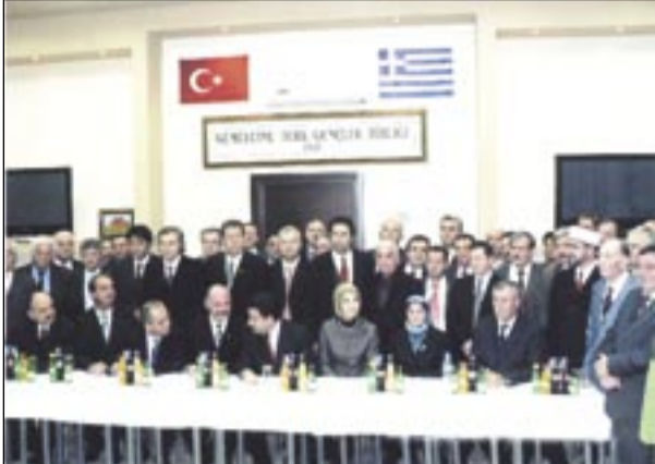
Ἡ ἀπόλυτη ἑλληνικὴ ξεφτίλα: Ὁ Τούρκος ΥΠΕΞ κάτω ἀπ' τὸ μπαϊράκι του καὶ τὴν ταμπέλα τοῦ διαλυμένου σωματείου, μετὰ ὅλη τὴ μειονοτικὴ ἡγεσία. Ἄ ναι, ἔχει κι ἑλληνικὴ σημαία!

ἐπίπεδο τριῶν δήμων (Ξάνθης, Κομοτηνῆς καὶ Διδυμοτείχου). Τὸ ποῖός θὰ ἐλέγχει αὐτὴν τὴν ἐκλογή δὲν χρειάζεται καὶ πολὺ μυαλό γιὰ νὰ τὸ φανταστεῖ κανεὶς... Μάλιστα εἶναι χαρακτηριστικὸς (καὶ ἐξαιρετικὰ δυσσιώωνος) ὁ τρόπος μετὰ τὸν ὁποῖον ὁ μουφτῆς μένει ἐντελῶς ἔξω ἀπὸ τὴν ἱστορία αὐτή: Μὲ δεδομένους τοὺς