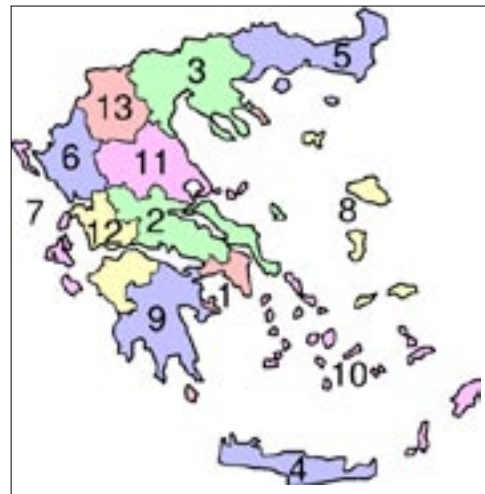
Οι σημερινές περιφέρειες της χώρας