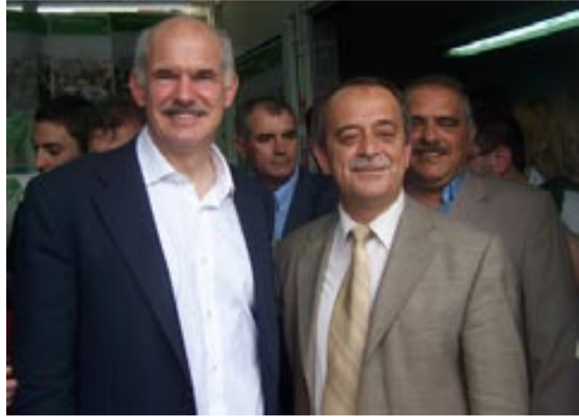
Στή Ροδόπη ὁ πασοκικός μηχανισμός ἔχει ἀπό χρόνια χαμογελάσει σέ ὅ,τι φανατικότερο ἔχει ἀναδείξει τό τουρκικό παρακράτος. Πρῶτα σέ ἐπίπεδο νομαρχίας, τώρα καί γιά τή Βουλή τῶν Ἑλλήνων. Πιο κάτω ἔχει;

μένουν νά ὑποστηρίξουν εἴτε τούς ἀπό χέρι χαμένους δευτέρους ὑποψηφίους τῶν μεγάλων κομμάτων (Σαῖτ Ἐρντογάν τῆς ΝΔ καί Κοτζιά Μουμίν Ριτβάν τοῦ