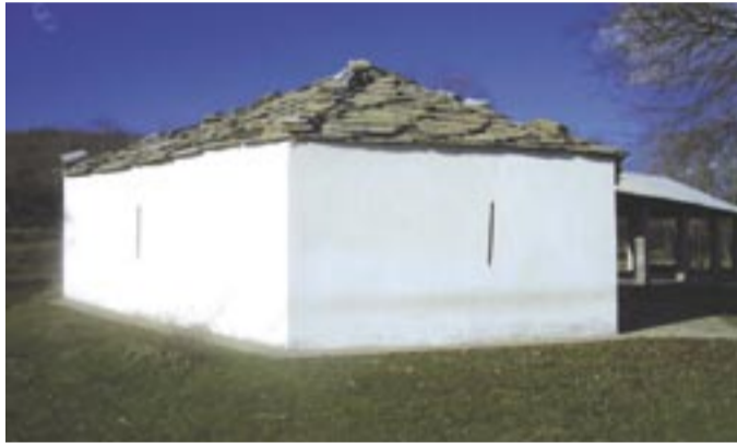
Ο τεκκές τῶν Σεϊντ Ἀλή Σουλτάν (Μικρό Δέρειο)

Οἱ Μπεκτασίδες μουσουλμάνοι τῆς Θράκης εἶναι μία παραμελημένη πληθυσμιακή συνιστώσα τοῦ τόπου μας, πού ἐπιβιώνει στά βόρεια ὄρια τῶν νομῶν Ροδόπης καί Ἑβρου. Τά ὄρεινά χωριά τους (Μέγα Δέρειο, Ρούσσα, Γονικό, Πετρόλοφος, Χλόη, Μεσημέρι...) σιγά σιγά ἐγκαταλείπονται, ὅμως τό πρόβλημα δέν εἶναι μόνο ἡ ἀστυφιλία. Τό βασικό τους «πρόβλημα» εἶναι ἡ ιδιαίτερη ταυτότητά τους, ἡ ὁποία φαίνεται νά ἐνοχλεῖ ιδιαίτερα κάποιους.