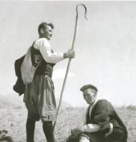
Απόφοιτοι του Τμήματος Παρευξενιών στοχάζονται

κάποιον άδιευκρινιστο λόγο, ότι ο σκοπός της παρουσίας του στο πανεπιστημιακό αυτό ίδρυμα δεν ήταν μονάχα η είσπραξη του μισθού κι ο έμπλουτισμός του βιογραφικού του (άντε, και η ύπερψήφηση του συγκεκριμένου πρυτανικού σχήματος). Μεταφέροντας, προφανώς, κάποια αρχαϊκά στερεότυπα από την πρώην Σοβιετική Ένωση, πίστεψε ότι οι απόφοιτοι της Σχολής, που βγαίνουν πιά και με πιστοποιητικό επάρκειας για την διδασκαλία της γλώσσας την οποία διδάχθηκαν (ρωσική, τούρκικη, κτλ), θα πρέπει και να την γνωρίζουν - έστω και σε έναν ελάχιστο βαθμό*. Είναι δυνατόν από τους 3 τόμους του εγχειριδίου της ρωσικής τό όποιο άλλο διδάσκεται σε έναν χρόνο, να μην διδάσκεται εδώ σε 4 χρόνια ούτε ο πρώτος μισός; Και τί ειδους εκμάθηση γλώσσας επιτυγχάνεται μονάχα με την μερική διδασκαλία ενός αλφαβηταρίου; Πώς να μην καταφύγουν όσοι φοιτητές όντως ενδιαφέρονται στα φροντιστήρια; Έκανε λοιπόν μερικές παρεμβάσεις σε συναδέλφους και άρμοδιους, με όσο διακριτικότερο τρόπο γινότανε για να μην θίξει κανέναν