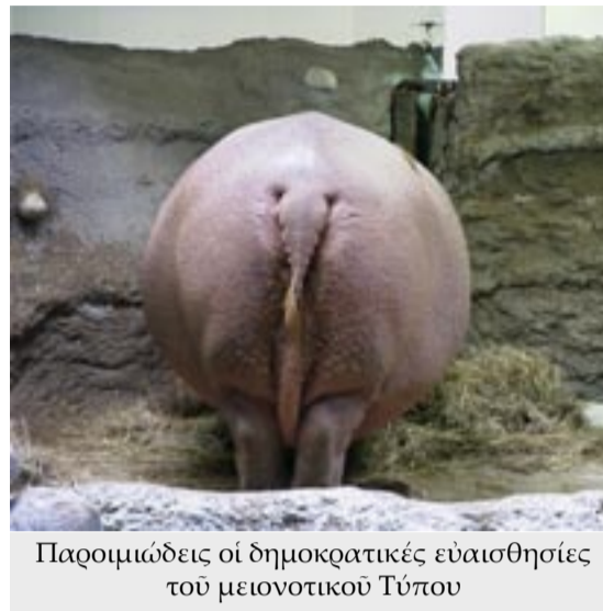
Παροιμώδεις οί δημοκρατικές ευαίσθητες του μειονοτικού Τύπου

στην Ξάνθη. Η εφημερίδα αιτιολογεί την επίσκεψη ως εξής: Ήρθε για να μάθει τις τακτικές που χρησιμοποιούν οι Έλληνες στην διοίκηση των μουσουλμάνων. Κατηγορεί την Γαλλία πως διέπραξε γενοκτονία στην Αλγερία και καταλήγει ως εξής: «Το ρατσιστικό κράτος της Γαλλίας επισκέπτεται την ρατσιστική Ελλάδα - που είναι ειδικός σε αυτά τα θέματα - για να μάθει τις τακτικές που