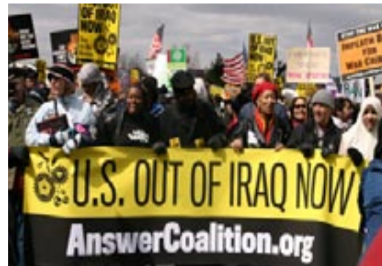
ΗΠΑ: Μαζικές διαδηλώσεις (50.000 στην Ουάσινγκτον, Λέι ή Μόντ) κατά της Κατοχής στο Ιράκ

Όπως ακριβώς ή Κατοχή της Ελλάδας από τους ναζί είχε και την καταστροφική οικονομική της διάσταση, έτσι συμβαίνει και στο αμερικανοκρατούμενο Ιράκ σήμερα. Προσέξτε τά συντριπτικά στοιχεία που βγαίνουν από τις ίδιες τις ΗΠΑ.