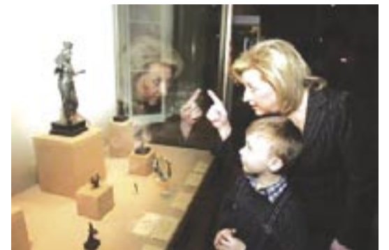
Και δέν είναι βέβαια μόνον ή ένέργεια. Προχθές πήγε στη Ρωσία ή Πετραλιά για να ψαρέψει τουρίστες που φέτος άναμένεται να αύξηθουν κατά 50% (έδω στό Έρμιτάζ)

τό 1989, όταν ή Ρωσία διέλυε τό Σύμφωνο τής Βαρσοβίας. Η ένέργειά μας αυτή είναι άκόμη πιο θλιβερή, άφου μετά από λίγες μέρες όριστικοποιήθηκε ή δημιουργία του άγωγού Μπουγκκάς - Αλεξανδρούπολης μέ έργοδηγό τον «τσάρο» Πούτιν, που