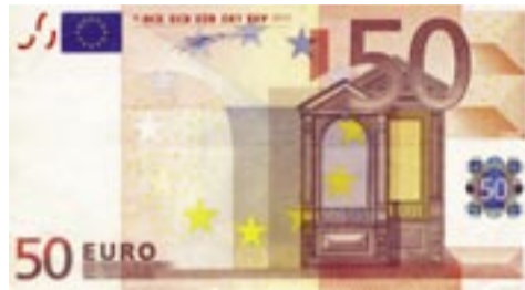
Τό ιδεόγραμμα της προεκλογικής έκστρατείας, ο μόνος κοινός τόπος υποψηφίων και ψηφοφόρων, τό «κάτι» πού μάς ένώνει

Καθώς προχθές τελείωσε και ο δεύτερος γύρος της εκλογικής έμποροπανήγυρης, μπορούμε να ριζούμε μία ματιά στο νέο τοπίο και να κάνουμε μία αποτίμησή του από τη θέση του ουδέτερου (μά και στοιχειωδώς απαιτητικού) παρατηρητή. Όχι τόσο σε εθνικό επίπεδο, όπου πολλοί ήδη τό πράξανε, όσο σε τοπικό - θρακικό. Σέ σχέση μέ τις δυνάμεις των κομμάτων πανελλαδικά, κάτι πού πάντοτε αποτελεί για τούς κρατούντες τό πρώτιστο διακύβευμα, είναι πασιφανές ότι τό κυβερνόν κόμμα διατήρησε τις δυνάμεις του, καθώς μεγάλη μερίδα του κόσμου δείχνει να έπενδυει ακόμη έλπίδες πάνω του. Τό ΠαΣοΚ παραμένει στά άζήτητα, πράγμα λογικό μετά από τρεις συνεχόμενες κυβερνητικές θητείες,