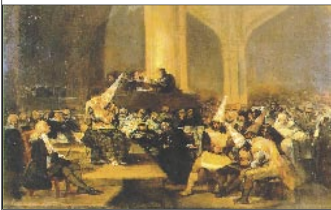
Φρ. Γκόγια: Σκηνή Τερας Εξέτασης

της ιστορικής μνήμης ή του σεβασμού της αλήθειας και των θυμάτων, ή Δύση αναβιώνει τό ιεροεξεταστικό της παρελθόν και θεσμοθετεί τις ολοκληρωτικές της νευρώσεις. Παραδίδει τή γραφίδα του ιστορικού στό χέρι του δικαστή και επιχειρεί να παγιώσει τήν εικόνα του παρελθόντος εκεί πού συμφέρει τήν σημερινή πολιτική κατάσταση. Τό αποτέλεσμα είναι τραγικό καθώς μία λογοκρισία επιβεβλημένη από δημοκρατικό θεσμό είναι ακόμη χειρότερη από εκείνη ενός δυνάστη: τί μπορείς να πεις όταν οι νόμιμες, «δημοκρατικά» έκλεγμένες αντιπροσωπεύσεις σε φιμώνουν; Και πώς είναι δυνατόν να συνεχιστεί ή ιστορική έρευνα όταν τό πλαίσιο της έχει όριστικά αποφασισθεί διά ροπάλου;