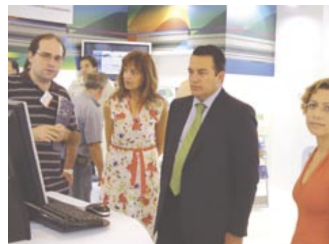
Ο Υφυπουργός Εξωτερικών Ευρωπαϊκής Στυλιανίδης στο περίπτερο του ΠΠΕΤ/ΑΘΗΝΑ

Η προβολή των δράσεων του ΠΠΕΤ με προβολή βίντεο, άναρτημένα posters, διανομή εντύπων και CDs με εφαρμογές που αναπτύχθηκαν σε διάφορα έργα συγκέντρωσε το ενδιαφέρον του κοινού και των επίσημων που το επισκέφθηκαν. Η προβολή του έρευνητικού έργου του ΠΠΕΤ άφορούσε στις τρισδιάστατες απεικονίσεις, στο εργαστήριο Αρχαιομετρίας, στις Μονάδες Πολιτισμικής Τεχνολογίας και Εκπαιδευτικής Τεχνολογίας. Το περίπτερο του Έρευνητικού Κέντρου Αθήνα που περιλάμβανε και έκθεση προϊόντων και δράσεων και των άλλων έρευνητικών Ίνστιτούτων του, ΙΕΑ και ΙΝΒΙΣ, επισκέφθηκαν μεταξύ άλλων στελέχη της Κυβέρνησης, εκπαιδευτικοί και έρευνητές. Η Εκπαιδευτική Πύλη ΕΔΡΑ ΕΚΠΑΙΔΕΥΣΗΣ προβλήθηκε με εύμεγες poster και την προβολή βίντεο με το κοινό, κυρίως εκπαιδευτικοί, να εκφράζεται με κολακευτικά σχόλια για τις υπηρεσίες που προσφέρει στον χώρο της εκπαίδευσης και την εύρεια άποδοχή που έχει κατακτήσει στο σύντομο διάστημα της λειτουργίας της. Η δράση προβολής στην 71η ΔΕΘ Θεσσαλονίκης, όπως και η αντίστοιχη που προγραμματίστηκε με την Έβδομάδα Έπιστήμης και Τεχνολογίας (Ζάππειο Μέγαρο, 28/6-5/7) χρηματοδοτήθηκε από το πρόγραμμα ΕΡΜΗΣ της ΓΓΕΤ.