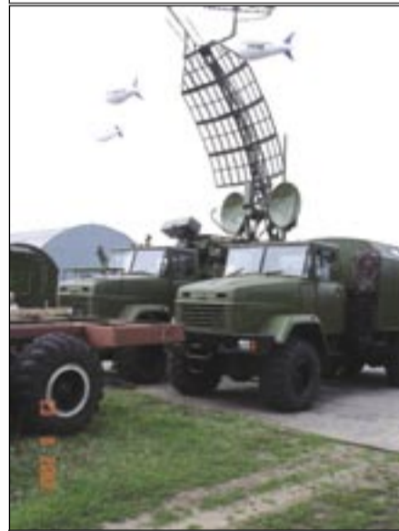
Kolchuga. Αυτό είναι τό όνομα του πλέον προηγμένου παγκοσμίου συστήματος παθητικού έντοπισμού άεροσκαφών (και Στέλθ!) που τό παράγει ή Ουκρανία και τό έχει προμηθευτεί σε άγνωστο άριθμό, σύμφωνα με τό έγκυρο Jane's Defence, τό άπειλούμενο από τούς γκάγκστερς Ιράν. Φυσικά και έπιχαίρουμε: Κάθε κίνηση άποτρεπτική του πολέμου είναι βήμα για τήν ειρήνη.