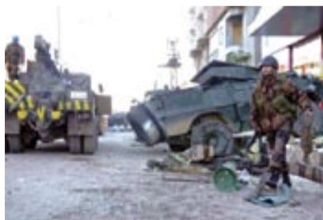
Χάκκαρι, πρόσφατα ἐπεισόδια