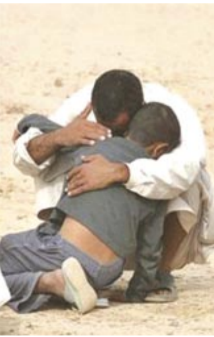
Διαλέξαμε τήν άνωτέρω φωτογραφία κι όχι μία από τίς δεκάδες φρικιαστικές που έρχονται καθημερινά από τό Ιράκ. Πάντως θα δημοσιεύσουμε και κάποιες σοκαριστικές, με θύματα βασανισμών, για όσους θαρρούν ότι τ' άφεντικά μäs είναι... άνθρωποι

Έκατοντάδες Ιρακινοί άκαδημαϊκοί και άνθρωποι του πνεύματος έχουν δολοφονηθεί από τήν ήμέρα τής δυτικής εισβολής στην πολύπαθη χώρα, τό 2003.