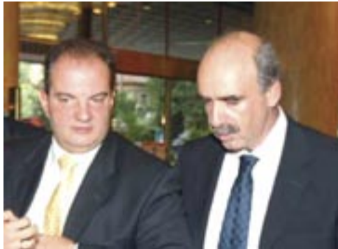
- Κοίτα τώρα, ως ύπουργός, νά πιάνεις τουλάχιστον κάνα στάνταρ!

1ο dvd (Πρωθυπουργός - ανδρική φωνή) - Έλα ρέ μα...α! Τι έγινε τό μάτς; - Χάσαμε κ. Πρόεδρε. 1-0... - Καλά ρέ π...η, είναι δυνατόν; Άντε, τή χώρα δέν μπορώ νά τήν κυβερνήσω, ούτε ένα μάτς δέν μπορώ νά πάρω... Ποιός τόβαλε; - Ό Κ... - Ός κι αυτό τό παλτό βρήκε δίχτυα; Γ... τή γκαντεμιά μου, μπάς καί στεκόταν από πίσω ό Μητσοτάκης; - Δέν τόν είδα κ. Πρόεδρε. - Κάτσε νά δώ μήπως κάναμε τίποτε στό