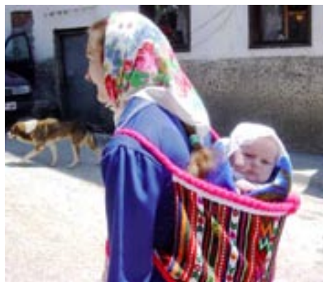
Παρακαλώ, μίν παρασύρεστε από τά φαινόμενα, άπατούν! Μπορεί νά μιλάει και νά ντύνεται πομάκικα, νά μοιάζει και νά ζεί ως Πομάκκα, μά στήν πραγματικότητα είναι γνήσια Τουρκάλα!

Μέ τά παραπάνω συγκινητικά λόγια ό κυρ-Όσμάν Νουρί Καμπασακάλ, σύμβουλος τού τουρκικού Υπουργείου Πολιτισμού και Τουρισμού, προσφώνησε τήν Τουρκική Ένωση Ξάνθης (Τμήμα Γυναίκων) πού τόν ύποδέχτηκε στή σάση πού έκανε επιστρέφοντας (15-1-06) από τήν έπίσκεψη του σέ Αθήνα και