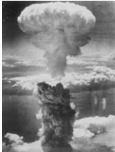
Είπε ο καπιταλισμός τόν κομμουνισμό εγκληματία

δεν έχουν αντιμετωπίσει μια συγκρίσιμη αντίδραση. Τα εγκλήματα σπάνια έχουν υποστεί μια νομική δίωξη και πολλοί από τους αυτουργούς δεν έχουν ποτέ συρθεί στη δικαιοσύνη. Κομμουνιστικά κόμματα εξακολουθούν να είναι δραστήρια σε κάποιες χώρες, και δεν έχουν καν πάρει αποστάσεις από το παρελθόν όταν υποστηρίζαν και συνεργάζονταν με τα εγκληματικά κομμουνιστικά καθεστώτα. Τα κομμουνιστικά σύμβολα χρησιμοποιούνται ανοικτά, και η δημόσια συνείδηση για τα κομμουνιστικά εγκλήματα είναι πολύ ισχνή. Η εκπαίδευση των νέων γενεών σε πολλές χώρες ασφαλώς δεν βοηθά να μειωθεί αυτή η απόσταση. Πολιτικά και οικονομικά συμφέροντα συγκεκριμένων χωρών επηρρεάζουν το βαθμό κριτικής κάποιων από τα