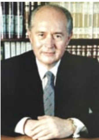
Μαντέψτε, πόσες λίρες έχω στα χέρια;

Συνάντηση, ή όποια έπιχειρήθηκε μέ κάθε τρόπο να κρατηθεί μακριά από τά φώτα τής δημοσιότητας, είχε χθές βράδυ μόλις έφτασε στην Κύπρο από τό Λονδίνο ό Βρετανός ύπουργός Έξωτερικών Τζάκ Στρώ μέ τόν πρώην Πρόεδρο τής Κυπριακής Δημοκρατίας Γιώργο Βασιλείου. Η συνάντηση πραγματοποιήθηκε στην οικία του Ύπατου Αρμοστή τής Βρετανίας στην Κύπρο και διήρκεσε περίπου 50 λεπτά. Ο κ. Βασιλείου μετέβη στην οικία του