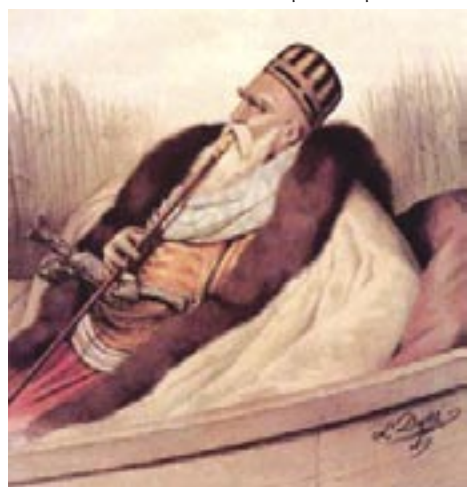
Κι αυτός καλός δέν θά ήταν για δήμαρχος Κομοτηνής; Στά Γιάννενα μά χαρά τά είχε πάει

μάνων πολιτευτών πού δέν πιστεύουν ούτε αυτά πού λένε (ούτε και στήν Δημοκρατία); Βεβαίως δέν είναι εύκολο νά γίνουν άπολογισμοί σέ τόσο άμφιλεγόμενα θέματα όπως είναι ή συνείδηση τών ανθρώπων, ώστόσο δέν μπορούμε νά άγνοούμε τίς περιπτώσεις στίς όποίες ό,τι κερδίζει ένας μειονοτικός