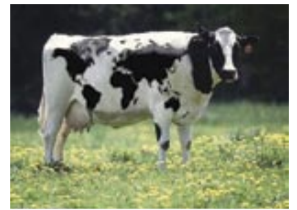
Παράγινε τό κακό μέ τήν παγκοσμιοποίηση...

Τα πτηνά που μολύνουν την Ανατολική περιοχή της Τουρκίας στα σύνορα με το