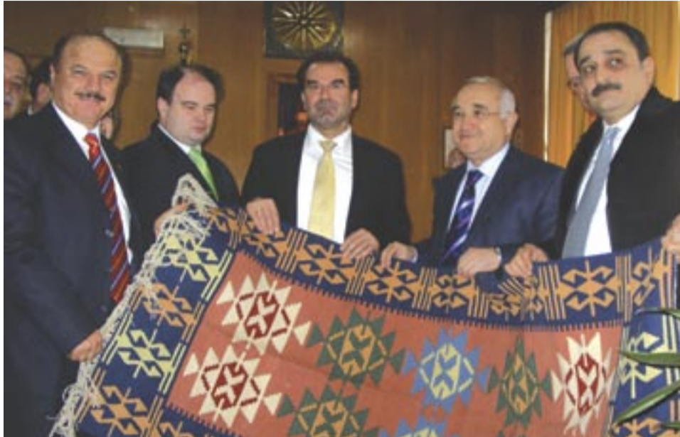
Δέν φτάνει πού έρχονται, μάς φορτώνουν και τά τρισβάρβαρης κακογουστιάς δώρα τους, ρέ γαμώτο...