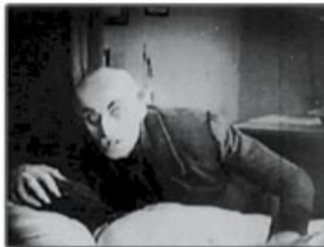
Ό γενάρχης σε παλιά του φωτογραφία (3.720 π.Χ.)

Άπό τό σημείο όμως αυτό, μέχρι την μέσω του προαναγγελθέντος άνασχηματισμού άπόλυτη ταύτιση των έπιλογών της έξωτερικής πολιτικής με τις έπιταγές της άγέλης που καταδυναστεύει την ύφήλιο, ή άπόσταση παραμένει χαώδης. Η σκανδαλωδώς προβαλλόμενη γόνος της τρίτης οικογένειας (με στενότατους δεσμούς με τό Μπουσέικο) ή όποια κληρονομική δικαιοματι διαφεντεύει τό κρατίδιο βορειοανατολικά της Άφρικής, προβάλλει από όλα τά «άνεξάρτητα» Μέσα ως σίγουρη σχεδόν διάδοχος του νύν ύπουργού Έξωτερικών, δίνοντας λαβή για μαύρες σκέψεις σε κάθε στοιχειωδώς έχέφρονα.