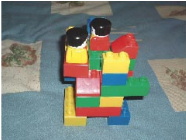
Η εσωστρέφεια και η φαινομενικότητα των ανθρωπίνων σχέσεων στις σύγχρονες κοινωνίες

Ο «Α» τιμώντας τις καλές τέχνες και σεβόμενος τις πρωτοποριακές εμπνεύσεις των σύγχρονων δημιουργών, έχει τη χαρά να παρουσιάζει στους αναγνώστες του, με αφορμή την επέτειο δύο χρόνων από τη μοντερνιστική έκθεση «Outlook» των συνουσιαζόμενων καρπουζιών και σταυρών, το μοναδικό αριστούργημα του βλοσυροειδούς του καλλιτέχνη και συνεργάτη του Γιάννη Στρούμπα.