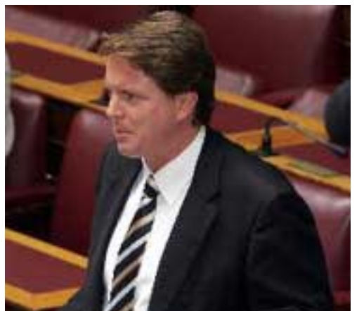
Επειδή πάντα κάτι δείχνει ή φάτσα μας, σκεφτείτε τόν βουλευτή (ΝΔ) Κερκύρας Νίκο Γεωργιάδη, που βρίσκει «μπουρδες» τά περί του μακεδονικού όνόματος: Τι προτιμήσεις και καταβολές (έθνικές, ιδεολογικές, κοινωνικές και άλλες) κραυγάζει;

Θά είναι θανάσιμο σφάλμα να υποκύψουμε στη λογική του «κλεισίματος» του θέματος μέ όποιανδήποτε όνομασία σήμερα. Αν δεν άφαιρεθεί όριστικά ή μακεδονική ψύχωση από τήν ιδεολογία των γειτόνων τό πρόβλημα θά παραμένει άνοιχτό. Κανένα βήμα πίσω από τήν κοινή άπόφαση των πολιτικών άρχηγών του 1992 και ταυτοχρόνως έπίθεση άλήθειας μέ οργανωμένο σχέδιο. Η όποιανδήποτε υποχώρηση στη λογική του κάθε κομψεύμενου ή άριστερίζοντα ΗΠΑνθρώπου, έντός κι εκτός Βουλής, θά όδηγήσει σε νέα αιτήματα για μειονότητες, για άποζημιώσεις του Έμφυλιου, για περιουσίες και ίθαγένειες. Αν όντως υπάρχει ελληνικό κράτος, όπως λένε όρισμένοι, να πάρει τό έμετικό κείμενο των «Ιών» και να τό άπαντήσει λέξη προς λέξη, δημιουργώντας ένα μικρό εγχειρίδιο προς χρήση κάθε έντιμου Έλληνα που και τήν ιστορική άλήθεια σέβεται και τόν πάτριό τόπο τιμάει. Η λογική των υποχωρήσεων γελοιοποιήθηκε στο Κυπριακό μέ τήν σωτήρια άπόρριψη του Σχεδίου Άνάν. Θά άφήσουμε τώρα τά ίδια συμπλέγματα να όδηγήσουν τή στάση μας έναντι πολύ ύποδε-στερου άντιπάλου;