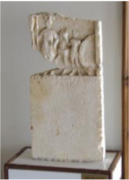
«Αμύντας Αλεξάνδρου χαίρε», γράφει η επιτύμβια στήλη στο Έθνικό Μουσείο, στα ελληνικά όπως κι ΟΛΑ τα αρχαία του εκθέματα

Ποτέ, μά ποτέ δεν γράφτηκε περί αυτής ούτε λέξη σε όθωμανικά και άλλων χωρών έγγραφα. Καμμία προξενική αναφορά, καμμία ταξιδιωτική ανάμνηση, κανένα κείμενο συνθήκης δεν αναφέρει τέτοιο έθνος. Χαρακτηριστικά αναφέρουμε το National Geographic του 1908 για το Μαυροβούνιο και το Carnegie Report του 1913 για την Όχριδα. Η ίδια η οργάνωση των επιτροπών του ΒΜΡΟ για την βουλγαρική υπόθεση, με την κραυγαλέα απουσία τους στον βορρά (Τέτοβο, Κουμάνοβο, Σκόπια) δείχνει ότι ο πληθυσμός εκεί ήταν άσχετος εθνολογικά. Μά και τα έθιμα - σαν εκείνο της «σάβας» που συνηθίζουν οι Σέρβοι τιμώντας τους οικογενειακούς τους άγιους και τα απαγόρευσαν οι Βούλγαροι στη διάρκεια των δύο περιόδων Κατοχής - δείχνουν τις σχέσεις πολλών περιοχών με το σερβικό στοιχείο.