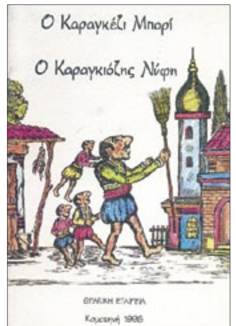
1996: Πρωτότυπη μορφωτικὴ καὶ πολιτιστικὴ παρέμβαση στοὺς μουσουλμάνους Ρωμῶν τῆς ὁδοῦ Ἀδριανουπόλεως