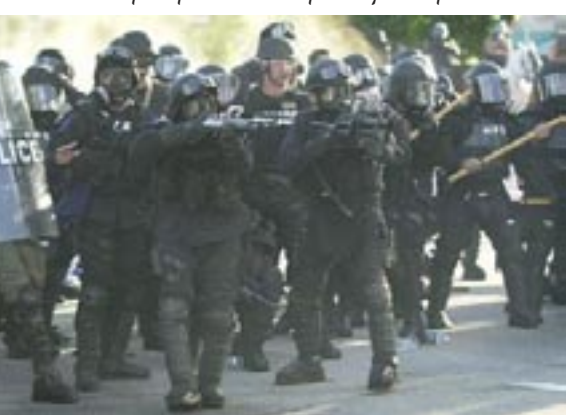
Νά που τελικά δέν είναι όλοι κατά της ελεύθερης αγοράς: Οί κύριοι της φωτογραφίας είναι υπέρ!