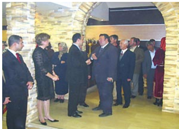
Η Πόλη βγάζει δήμαρχο κι ο Πρόξενος κλητήρα