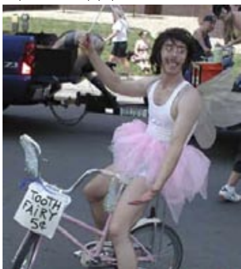
Θά μπορούσαμε να μιλάμε για τόν... Σταχάνοφ τού σήμερα: Και «ρόζ» και οικόλογος (ποδηλάτης γάρ)

Όλα αυτά βέβαια έχουν την ιστορία τους και την προϊστορία τους. Ό Άριστερισμός στην Ελλάδα δομήθηκε πάνω σε δύο πυλώνες: