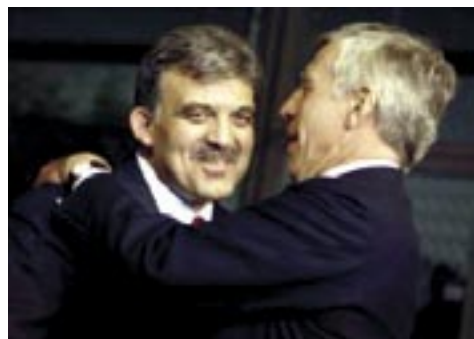
- Σταμάτα μωρή τρελλή, μπροστά στον κόσμο!

Τρανή απόδειξη ότι δέν συμβεί αυτό είναι ότι ακόμη και τήν περίοδο που υποτίθεται