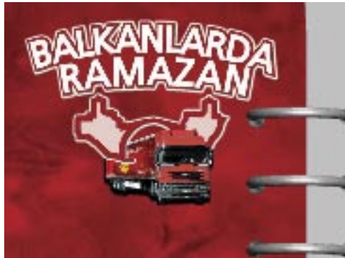
Τό σήμα της έκστρατείας του Δήμου. Δεκάδες οι κρατικοί και μή χορηγοί της

Πουναριστάν, 2005: Έθνικά μεσάνυχτα κι όλη η Θράκη ήσυχαζει. Όλη; Όχι ακριβώς. Κάποιοι κινούνται δραστήρια για την ντέ φάκτο μετατροπή της περιοχής σε τουρκική επαρχία με ελληνική μειονότητα και σκιώδη ελλαδοκρατική παρουσία. Τα αποτελέσματα λίγο λίγο άχνοφαινόνται, όμως κανείς δεν άνησχυεί. Έχουμε, σου λέει, κράτος, στρατό, αστυνομία, νομαρχία, υπηρεσίες, νόμους... Τό λένε όλοι, τό λέει και η τηλεόραση, κάπου ανάμεσα στον μουράτ και στον μπακλαβαρχίδογλου.