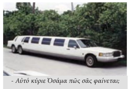
- Αυτό κύριε Όσαμά πως σας φαίνεται;

άντάρτες προτιμούν τα αμερικανικά κλεμμένα αυτοκίνητα γιατί συνήθως είναι μεγαλύτερα, ανακατεύονται πιο εύκολα σε αμερικανικά κονβόν και αποδεικνύεται δυσκολότερα ότι είναι κλεμμένα.» Δηλαδή, αν κατάλαβα καλά, ο Μπίν Λάντεν και οι ιρακινοί άντάρτες έλέγχουν τα κλεφτρόνια στις ΗΠΑ, κλείνουν μαζί τους συμφωνίες, φορτώνουν τ' αυτοκίνητα σε αμερικανικά λιμάνια και τα κουβαλάν από τήν άλλη άκρη της ύφης; Κι αυτά τα αυτοκίνητα περνάν πιο άπαρητήρητα από τα ιρακινά; Κι όλα τούτα τα κάνει εκείνος ο σατανικός Μπίν Λάντεν, προκειμένου να έχει μεγαλύτερο πόρτ μπαγκάζ; Και δέν εισάγει τίποτε άλλο (π.χ. όπλα) από τις ΗΠΑ, παρά μόνον εύρύχωρα στείσον βάγκον, τού ύπερόπλο του 21ου αιώνα; Μήπως πρέπει να άπαρηρευτούν και τα συγκριτικά τέστ τών αυτοκινήτων, καθώς κάτι Καββαθάδες άνοίγουν τα μάτια στους τρομοκράτες; Λέω, μήπως,