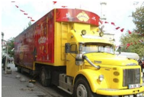
Τό καραβάνι ξεκινάει...

Στις 27-29/9 διεξήχθη στην Βαρσοβία ή σύνοδος του ΟΑΣΕ κατά τήν όποία Μή Κυβερνητικοί Όργανισμοί αναφέρονται σε προβλήματα ανθρώπινων δικαιωμάτων ανά τόν κόσμο, ένώπιον 200 περίπου διπλωματών πού είναι οι μόνιμες άντιπροσωπείες τών χωρών. Άς δούμε κάποια άποσπάσματα από τήν είδηση όπως τήν περιγράφει ή μειονοτική Γκιουντέμ (7-10).