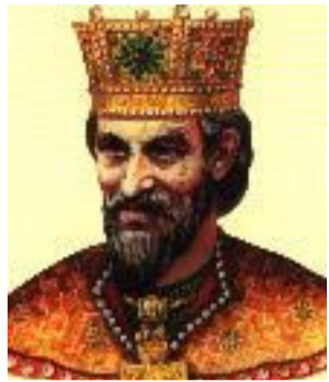
Ό Τσάρος Βόγορις

γλωσσικής του ενοποίησης, οδήγησε αρχικά στον εκχριστιανισμό της χώρας (επίσημως το 864), αλλά και στην υιοθέτηση αργότερα του σλαβικού αλφαβήτου (που είχε επινοήσει ο Άγιος Κύριλλος). Έτσι το βουλγαρικό κράτος απέκτησε ενιαία για όλους θρησκεία και ενιαία επίσημη γλώσσα, που για πρώτη φορά διέθετε και το απαραίτητο προσόν της γ ρ α π τ η ς ξ κ φ ρ α σ η ς (ύπενθυμίζω ότι τόσο η σλαβική, όσο και η ασιατικής προέλευσης βουλγαρική ήταν μόνο προφορικές γλώσσες και γι' αυτό η βουλγαρική πολιτική ήγησης αναγκαζόταν