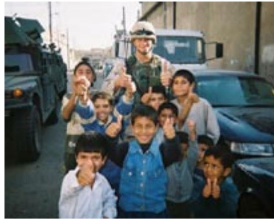
Η αναφορά του ανθρωπιστικού οργανισμού IRIN (The Integrated Regional Information Networks)