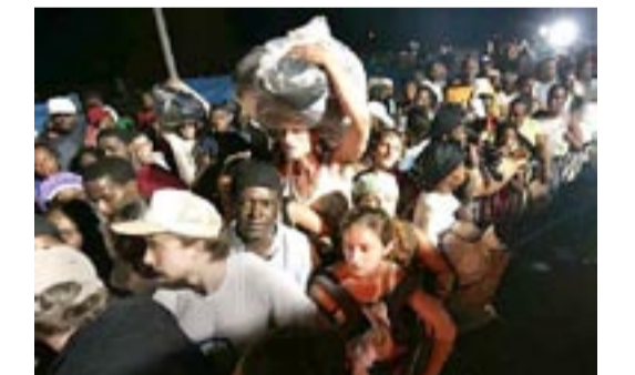
Κι ένφ άνθρωποι πάλευαν για ένα μέσον φυγής, έκκενώθηκε ξενοδοχείο σκύλων με 150... πελάτες!

Υ.Γ. Πέρα από τήν ιαπωνική άποτελεσματικότητα στην άντιμέτωπιση του τυφώνα Νάμπι, θυμίζουμε ότι και στήν... Κούβα τυφώνας ίδιας με τήν Κατρίνα έντασης, άντιμετωπίστηκε πέρσει ύποδειγματικά, με κινητοποίηση λαού και στρατού, μεταφέροντας 1,5 εκ. ανθρώπους και μηδενίζοντας έτσι τίς άπώλειες ζωών!