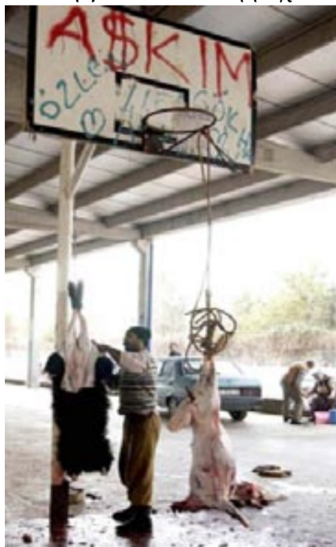
- Μά πώς προλάβαινε ό παππούς τρείς Ρωμηούς sé μισή ώρα...»