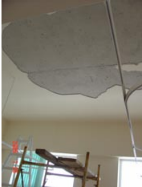
Όχι, δεν είμαστε στο στάδιο κατασκευής. Είμαστε στον δεύτερο χρόνο χρήσης του κτιρίου και οι σκαλωσιές επανήλθαν...

Ουδείς μπήκε στον κόπο να απαντήσει στα πολύ συγκεκριμένα ερωτήματα / καταγγελίες που απευθύναμε ονομαστικά στο προηγούμενο τεύχος στους καθ' ύλην αρμόδιους, δίνοντάς μας το δικαίωμα να υποθέτουμε βάσιμα ότι υιοθετούν αυτό το λέει ο Χρ. Γιανναράς στην τελευταία του έπιφυλλίδα: η καθιερωμένη αντιμετώπιση των ένοχλητικών για τους κρατούντες είναι να άγνοούνται επιδεικτικά, να εξορίζονται όσο είναι δυνατόν από τη δημοσιότητα. Δυστυχώς γι αυτούς (και για όλους